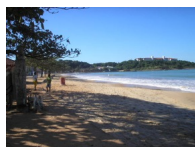
Vista da Praia de Ubu/Anchieta/ES