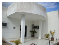
Sede da Pestalozzi em Anchieta

Nessa mesma administração, membros da comunidade anchietense criaram a Sociedade Pestalozzi de Anchieta, cuja “Escola Cativar” mantida em parceria com a municipalidade foi inaugurada em 31 de Dezembro de 1999, atendendo pacientes de diferentes faixas etárias, e com dificuldade também diversa (de origem mental e/ou física), provenientes, em sua maioria, do Sistema Único de Saúde (SUS).