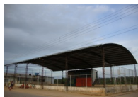
Quadra de esporte do bairro Nova Esperança

No governo do prefeito Moacir Assad, algumas conquistas foram obtidas, em infra-estrutura urbana, tais como, calçamento das ruas e rede de esgoto, como também a cobertura da quadra de esportes.